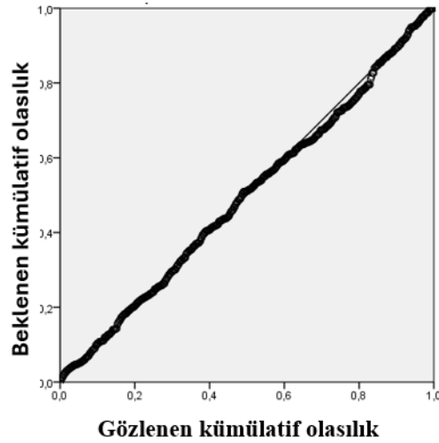
Şekil 2. Standardize Edilmiş Artık Değerlere İlişkin P-P Grafiği