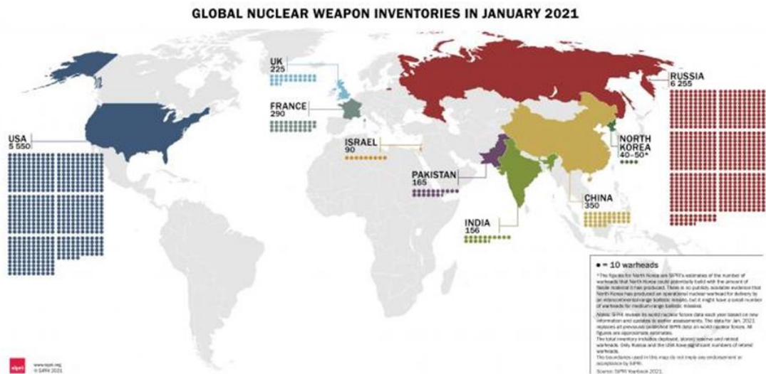
Şekil 1. Ocak 2021'e göre dünya nükleer silah envanterleri

Dünya ülkeleri, nükleer silahları büyük bir güvenlik tehdidi olarak algılamış, bu silahlara karşı caydırıcılığın yine bu silahları elde etmekle mümkün olunabileceği yolunu tercih etmiştir. Neticede, başta SSCB olmak üzere birçok ülke kısa bir süre sonra nükleer silahları elde etmeyi başarmıştır. Bütün dünyayı tehdit eden nükleer silahların çoğalması ile ülkeler, daha çok tedirginlik yaşamaya başlamış, bu silahların yasaklanmasını ve yayılmasını engelleme arayışları başlamıştır. Gelineen süreçte her ne kadar yapılan anlaşmalar, nükleer silahların artmasını yavaşlattıysa da yayılmasını ve oluşturduğu tehlikeyi ortadan kaldıramamıştır. Özellikle nükleer silahlara sahip BM'nin beş daimi ülkesi, nükleer silahlardan vazgeçtiklerini dünya devletlerine ikna edici bir şekilde ortaya koymadıkları müddetçe bu noktada başarılı olmak inandırıcı görünmemektedir. Bu durum, ülkelerin nükleer silahları elde etme arayışlarından vazgeçmemesine neden olmaktadır.